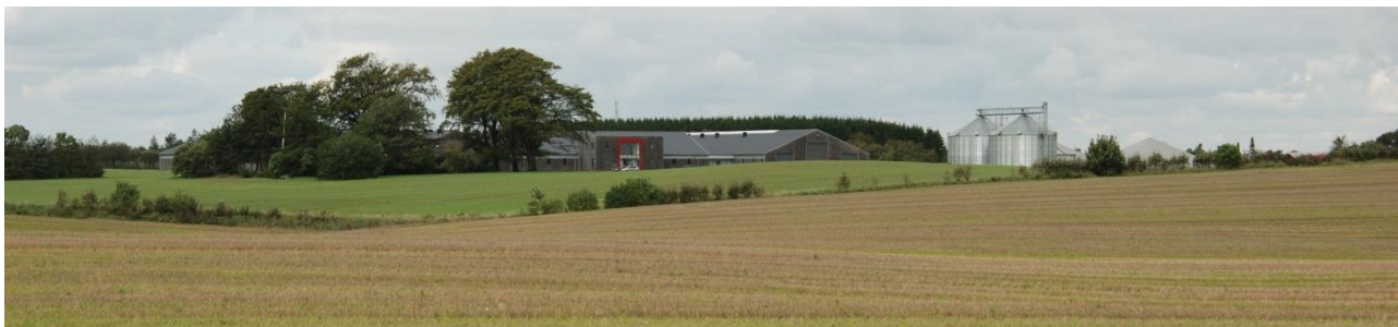
Et bygningsanlæg som er "støtte" af beplantning

Beplantninger i det bygningsnære område, skal understøtte det samlede bygningsanlæg og gerne have en eller anden form for sammenhæng til beplantninger i det åbne landskab.