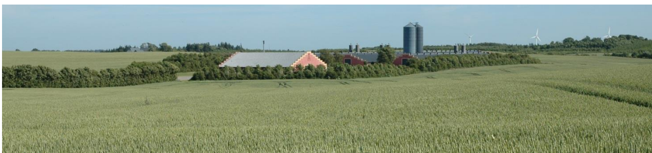
Et bygningsanlæg som er ved at blive totalt inddækket med en tæt beplantning